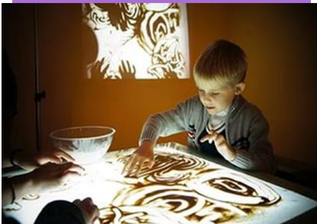
Световой стол и техника «рисование песком» в работе педагога-психолога.

Песочная терапия – это возможность выразить то, для чего трудно подобрать слова, соприкоснуться с тем, к чему трудно обратиться на прямую, увидеть в себе то, что обычно ускользает от сознательного восприятия.